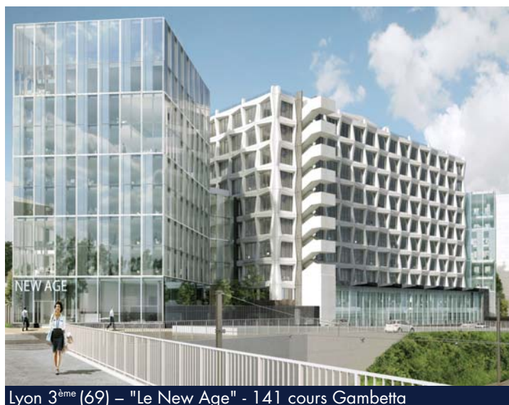
Lyon 3 ème (69) – “Le New Age” - 141 cours Gambetta