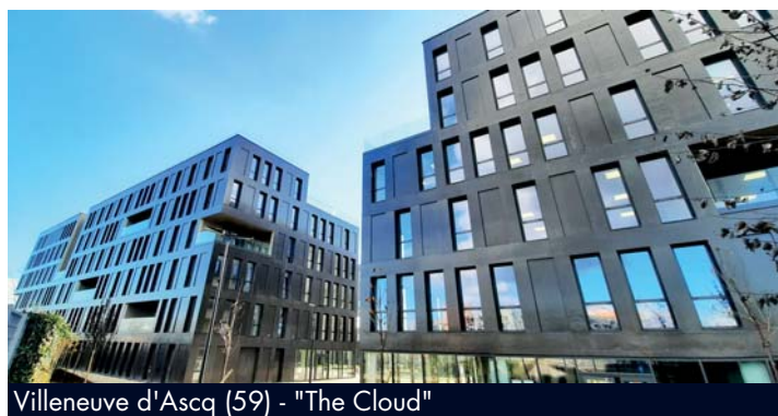
Villeneuve d'Ascq (59) - "The Cloud"

Le 4 novembre 2020, Notapierre a pris livraison d'un immeuble implanté face à la station de métro « 4 Cantons Stade Pierre Mauroy » à Villeneuve d'Ascq (59), acquis en état futur d'achèvement le 10 juillet 2018 au prix de 37,96M€ HT. Cet ensemble immobilier composé de deux corps de bâtiments de cinq étages, agrémentés de 438 m 2 de terrasses accessibles, représente une surface utile brute locative de 13 274 m 2 à usage principal de bureaux, avec un parc de stationnement comportant 343 places. Sur le plan environnemental, il est certifié BREEAM Very Good ainsi que WELL niveau Silver. L'immeuble, dont la commercialisation est en cours, bénéficie d'une garantie locative de 18 mois.