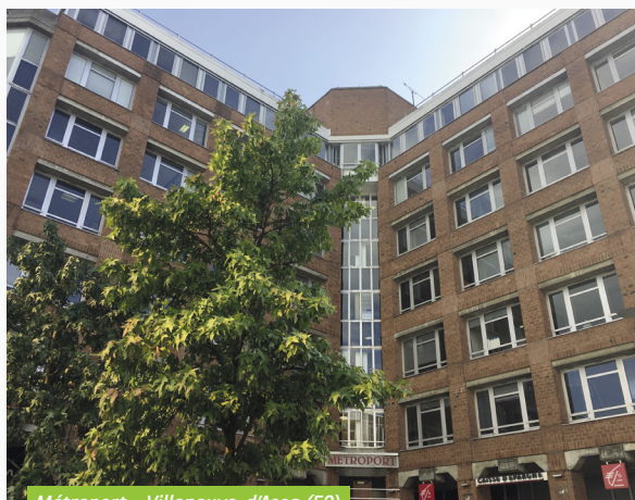
Métroport - Villeneuve-d'Ascq (59)

En plus du renouvellement de bail signé sur l'actif du Métroport, deux avenants ont été signés avec deux autres locataires de cet immeuble afin de reporter un congé d'un an d'une part et de renoncer à une prochaine option de sortie d'autre part. Ces signatures consolident l'état locatif de cet actif récemment mis en vente et qui a reçu plusieurs offres d'achat.